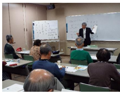
老後の家計を乗り切る 11. 18