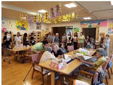
介護の知識と施設見学 7. 29