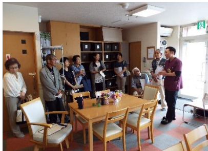
介護予防と施設見学 7. 25

今年度のシニアサロン事業全3回、延べ8日間が終了しました。総参加74名で、学び・楽しみ・交流しました。また、来年♥