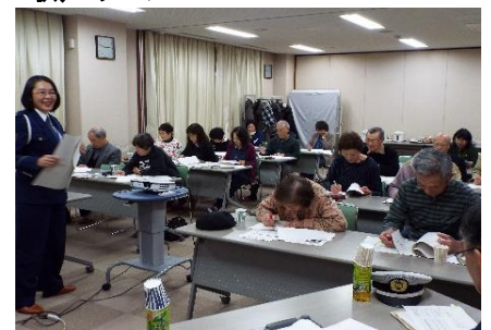
車社会も高齢化 11. 25