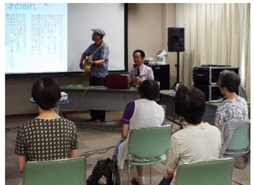
歌声サロン 8. 27 9. 3