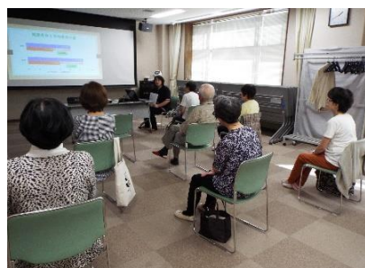
健康体操 9. 17・24